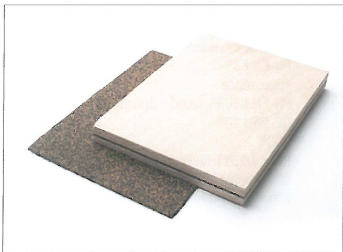
*wyrób certyfikowany FSC®